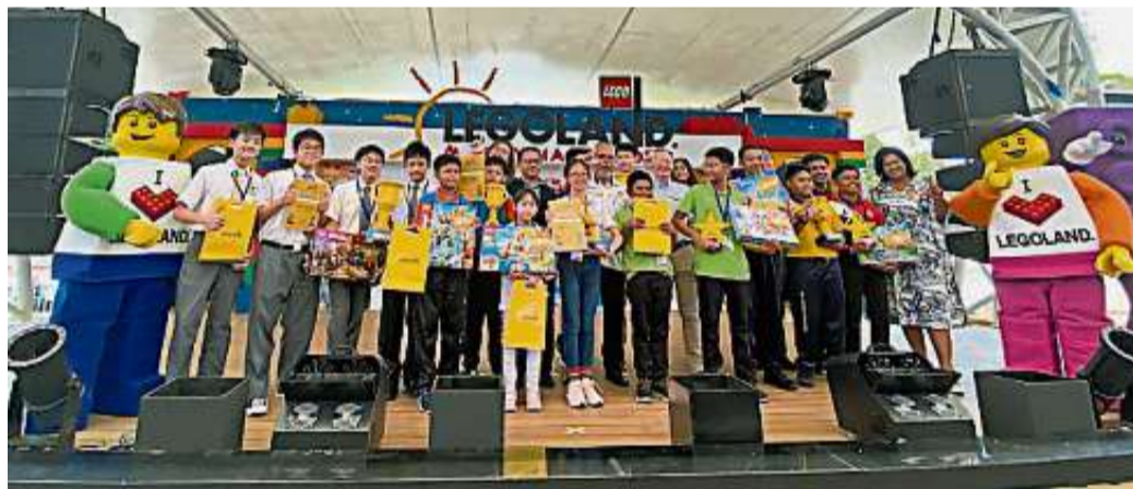
大马乐高乐园为首届“乐高星球, 学校挑战”举行颁奖礼。

(新山2日讯) 大马乐高乐园今日为“乐高星球, 学校挑战”举行颁奖礼, 吉隆坡卫理卫理公会国际学校 (Wesley Methodist School Kuala Lumpur) 荣获全国冠军宝座。